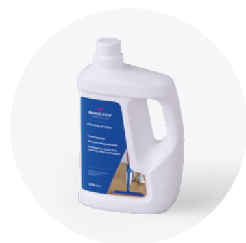
Tisztítószer, 1 l vagy 2,5 l QSCLEANING1000 QSCLEANING2500

Ezt a tisztítószer kifejezetten a Quick-Step padlókhöz tervezték. Alaposan tisztítja a padló felületét és megóvja eredeti kinézetét, hogy Ön minél tovább élvezhesse az új padló élményét.